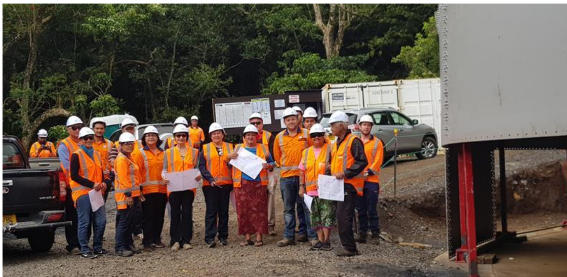
Landowners site visit at Turangi

Te rauka nei i te PMU i te oronga atu i te akameitaki'anga maata kite au atu enua katoatoa ko kotou tei 'anga'anga kapiti mai e tei turuturu pakari i teia tu'anga 'anga'anga. MEITAKI MA'ATA!