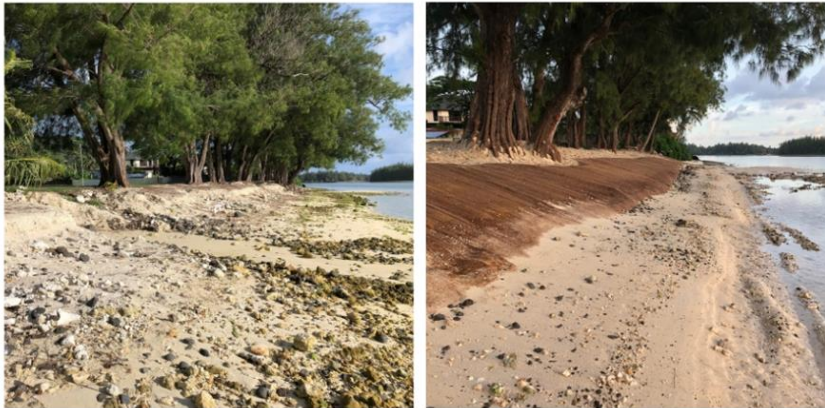
Nukupure Beach before and after

rikiriki ei te moenga puru akari, irinaki'anga e kua matutu te tupu'anga ote au rakau te ka riro ite paruru ite one auraka kia pakokoia ki roto ite tai. Te tamanakoia nei e ka oti ite putuputu'anga MEC ite tanu ite au rakau i mua ake ite openga ote marama Mati.